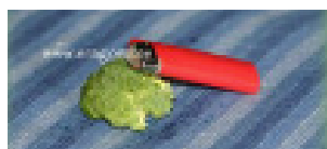
12 g broccoli