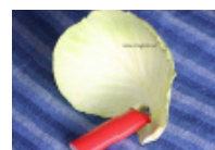
22 g vitkål