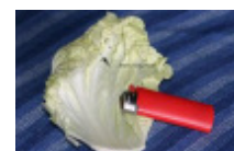
26 g salladskål