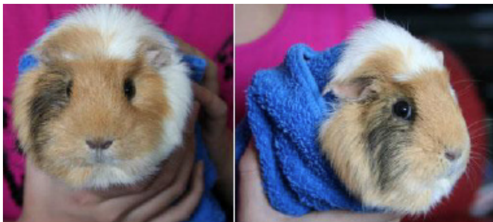
Inlindad Hera. "Voffo gör di på detta viset?"

Det är fall och slag de är känsliga för, inte ett jämnt tryck över hela kroppen. Tänk på att till och med våra egna ömtåliga människobebisar klarar påfrestningen av att födas fram, och det är ett riktigt hårt men jämnt tryck. Det tror jag att varenda mamma kan skriva under på. De går heller inte sönder av att du håller fast deras huvud för att kunna få i dem stödmatning med hjälp av spruta. Även här brukar jag använda mig liknelsen av små barn. Inte låter du ditt lilla barn komma undan att äta eller byta blöja bara för att det skriker.