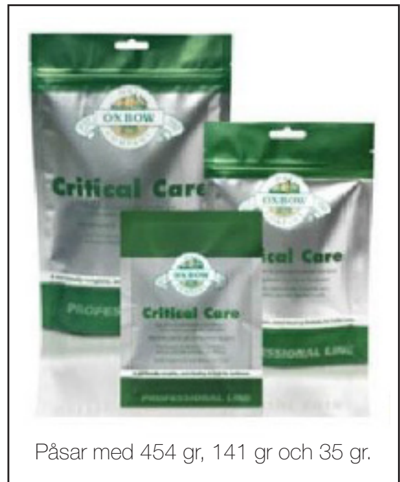
Påsar med 454 gr, 141 gr och 35 gr.

En stor fördel med C-vitaminvattnet är att CC:n lättare går ner i ett motsträvigt marsvin när man får sköljt ner det lite. Tänk själv. Det är lättare att hålla kvar något fast eller en gröt i munnen än vätska. Vatten måste man helt enkelt svälja ner för att bli av med.