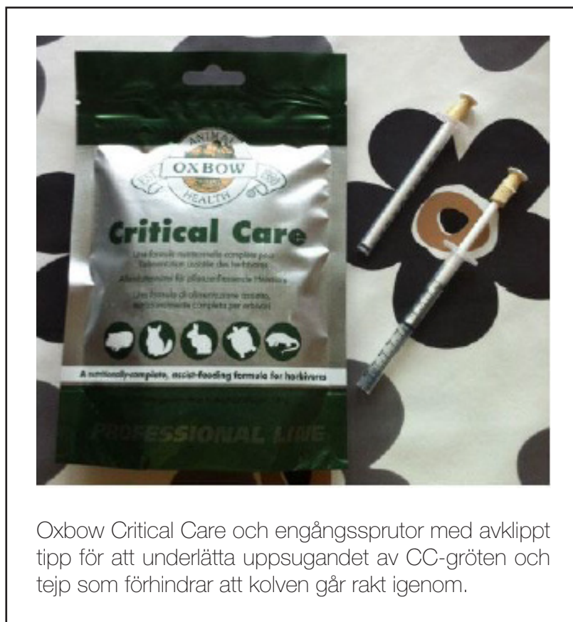
Oxbow Critical Care och engångssprutor med avklippt tipp för att underlätta uppsugandet av CC-gröten och tejp som förhindrar att kolven går rakt igenom.

Hur bär jag mig då åt när jag skall få i min guldklump den magiska CC:n? Personligen så föredrar jag att ha marsvinet på en handduk i knät eftersom det kan bli ganska söligt. Om marsvinet sprattlar eller försöker ta sig undan så kan det vara bra att linda in det rätt så tight i en handduk. Ditt marsvin går inte sönder även om du lindar ganska hårt.